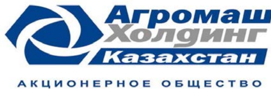
ТОО «Комбайновый завод «Вектор»