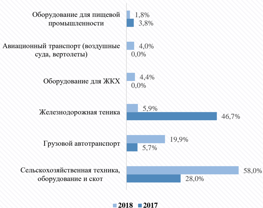
Доля основных предметов лизинга в структуре новых сделок лизинговых компаний Республики Казахстан